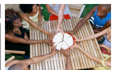
Equosolidale Una nuova economia